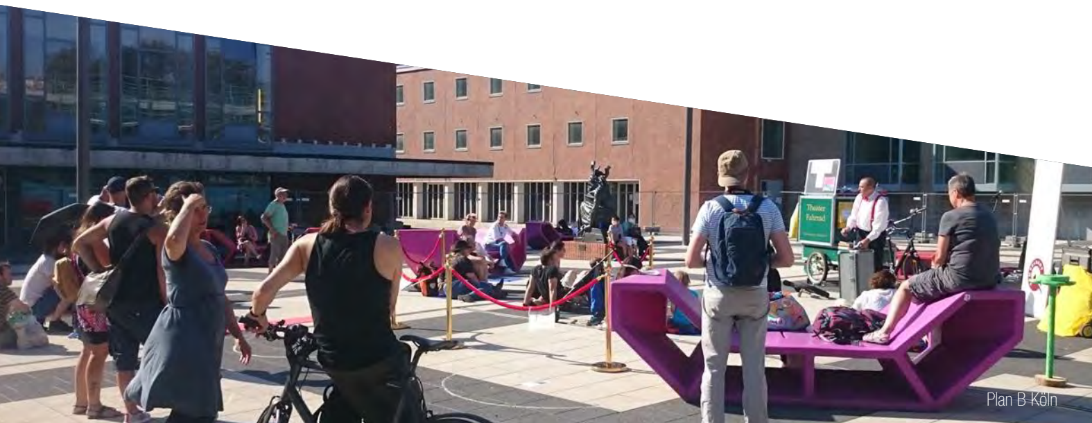
Plan B Köln

Um auf die Einhaltung der Maßnahmen zu achten und bei Fehlverhalten diese durchzusetzen gibt es Aufsichtspersonen am Einlass und bei den Sanitäranlagen. Zudem ist die Veranstaltung auf 60 Minuten ohne Pause begrenzt.