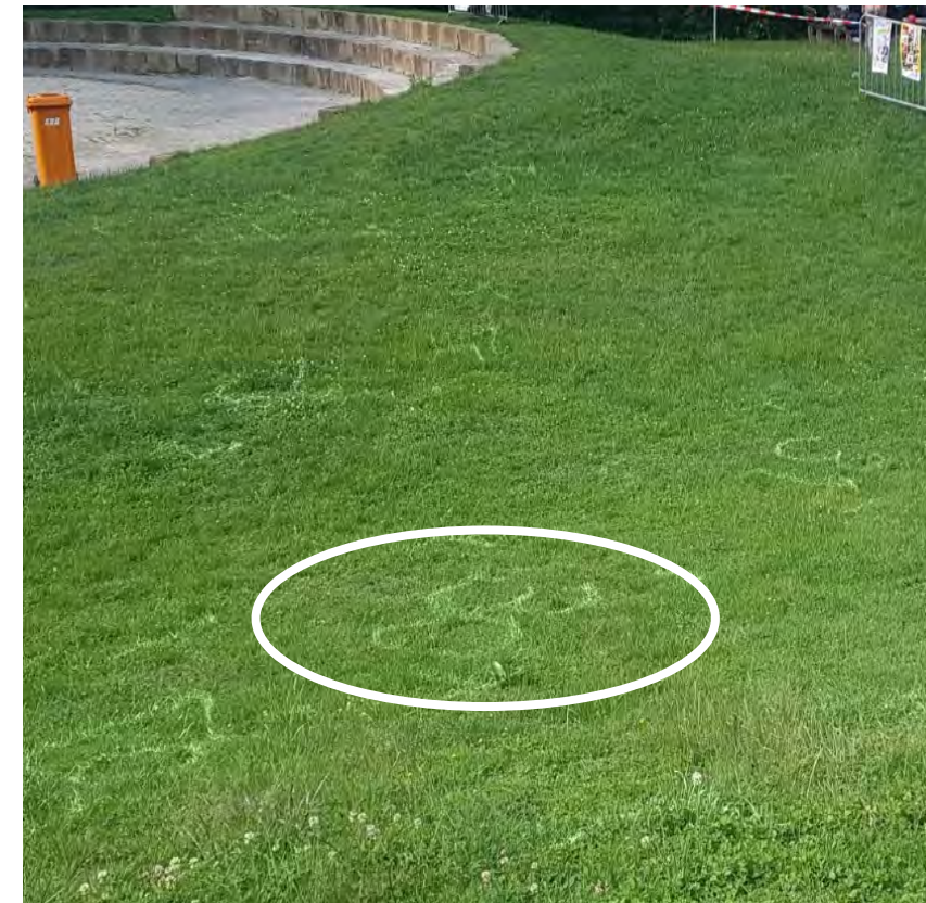
Kreidemarkierungen auf der Wiese weisen die Besucher an auf welchen Platz sie sich setzen dürfen.

Auf das Gelände dürfen maximal 100 Personen, zudem muss zum Künstler ein Abstand von 3m eingehalten werden. Es gibt nummerierte Bereiche, in denen die besuchenden Personen Platz für eine Picknickdecke haben. Auf dem gesamten Gelände sind Informationstafeln zum infektionsschutzgerechten Verhalten aufgestellt.