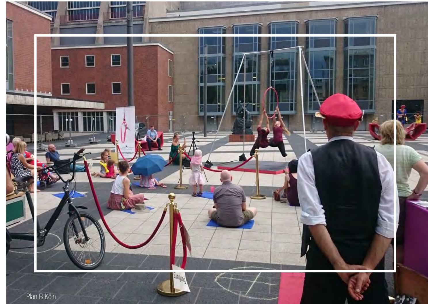
Plan B Köln